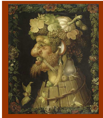
Giuseppe Arcimboldo, Autumn, 1573

A l'image du marron et de la châtaigne à qui l'on doit ôter la bogue avant de les savourer, la Fête du vin nouveau est l'un de ces événements rares, qui se mérite et ne se laisse croquer qu'en attendant le cœur de l'automne.